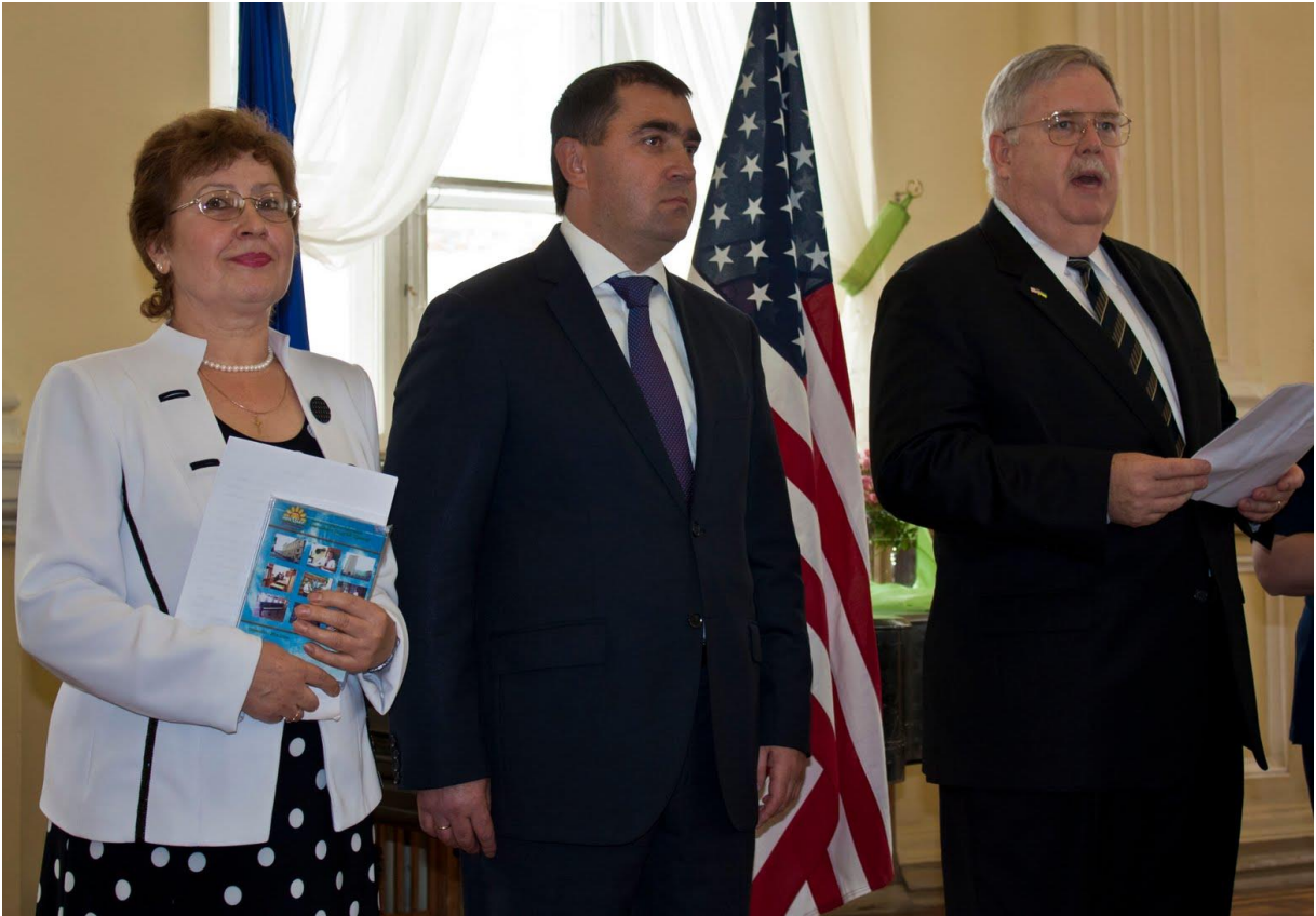
Відкриття Інтернет-центру в ХДНБ ім. В. Г. Короленка. Зліва направо: В. Д. Ракитянська; заступник голови ХОДА В. В. Хома та Надзвичайний і Повноважний посол США в Україні Дж. Теффт. м. Харків, вересень 2011 р.